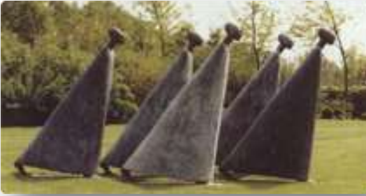
Tjikkie Kreuger mensen op weg