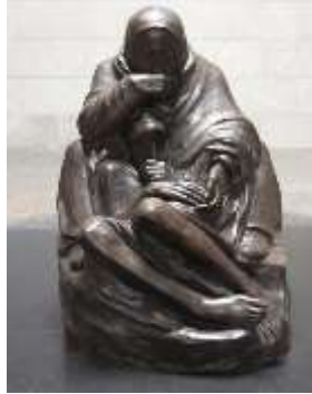
zelfportret van Käthe Kollwitz beeld Neue Wache, Berlin