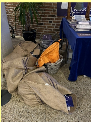
Vele postzakken vol