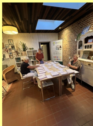
Vrijwilligers sorteren de kaarten op geadresseerde