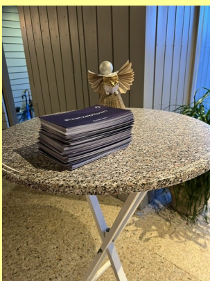
Onze stapel kaarten

Ook wij als kerk hebben veel kaarten geschreven, op 28 mei heb ik die naar Kampen gebracht.