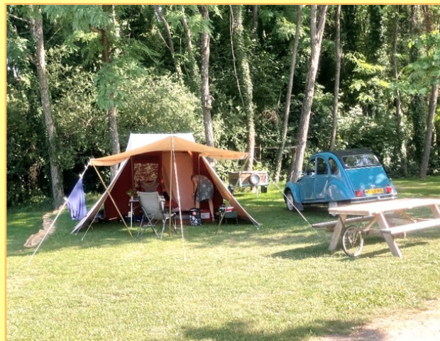
Camping – La Jonquille